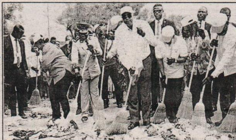
Le Premier ministre Patrick Achi a participé au lancement de cette 7ème édition de la semaine nationale de la propreté.

Cette 7ème édition de la Semaine nationale de la propreté, selon le Premier ministre Patrick Achi, contribue à l'amélioration et à l'assainissement de la ville de Yamoussoukro. A l'en croire,