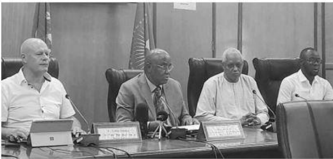
Les experts ont sensibilisé les femmes et hommes de médias africains autour des enjeux de l'eau en Afrique.