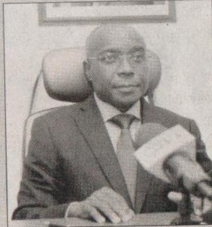
Bouaké Fofana a encouragé les participants à s'impliquer dans l'adoption de ces 3 documents

Le ministre de l'Hydraulique, de l'assainissement et de la salubrité, Bouaké Fofana a ouvert le mercredi 24 Août 2022, au Centre des métiers de l'électricité (Cme) de Bingerville, le deuxième atelier sur la validation des éléments déclencheurs du Programme d'Appui des Réformes Economiques et Sociales (Pares-3). Le ministre a qualifié cet atelier de hautement important. A l'en croire " Cet atelier dont les livrables seront très déterminants pour la mise en œuvre du Pares, compte tenu des ressources qu'il permettra de générer avec la tenue, le 19 octobre 2022, du board de la Banque africaine de développement qui va autoriser l'octroi d'un appui à l'Etat de Côte d'Ivoire". Toujours selon lui, les documents qui feront l'objet d'étude durant ces trois jours, s'ils sont validés, permettront également de garantir les appuis d'autres partenaires notamment la Banque islamique de développement (Bid) et l'Agence japonaise de coopération internationale (Jica).